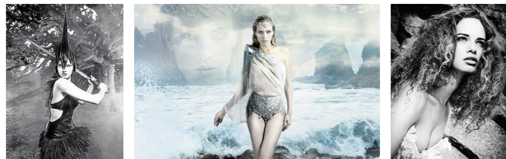
Model Barbara Meier Petra Nemcová als schaumgeborene Venus und... ...Jagdgöttin Artemis.